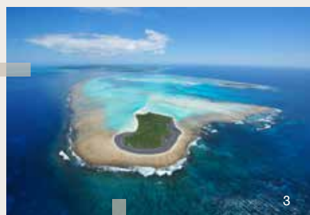
1- Munida zebra Macpherson, 1994 © Laure Corbari / MNHN / PNI ; 2- Baie Gadji, Ile des Pins © Martial Dosdane / Province Sud ; 3 - Ilot Nuami, Ile des Pins © Martial Dosdane / Province Sud.