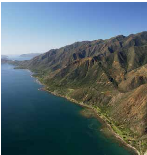
1 - Côte Oubliée