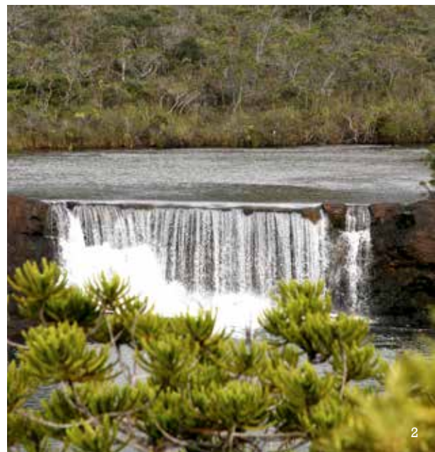
2 - Chutes de la Madeleine sur la Rivière des Lacs